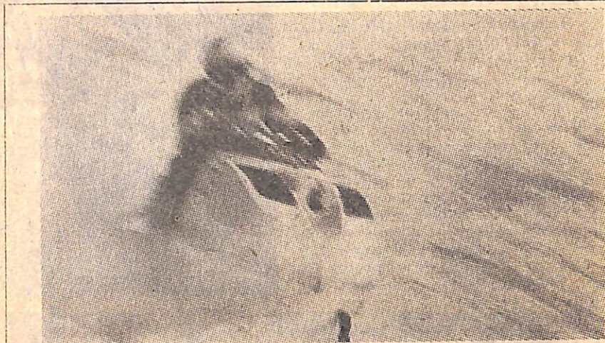
Из коллекции НФС «Образ». С. Черепанов, «Скорость». Г. Кудряшов, «В закрытом парке». Авторы этих снимков признаны победителями фотоконкурса «Военно-технический спорт — в массы», проведенного комитетом ДОСААФ в начале нынешнего года.