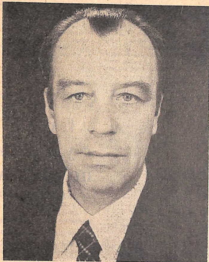
Портрет с доски Почёта

По отделам: указано ЖКУ за нарушение общественного порядка, отмечена неудовлетворительная работа ОБК и ОТС.